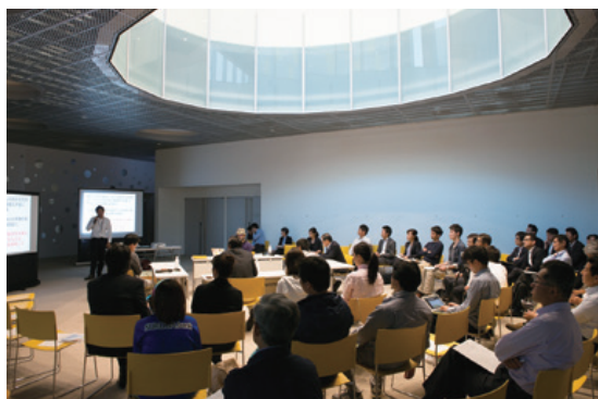
積極的な意見交換が行われる戦略会議

期待される効果としては「雇用の創出」「コミュニティの再生」「エリア価値の向上」などが挙げられ、「建て替えと比べて初期投資を抑制できる」「事業のスピードが早い」という特徴があり全国でも取り組む自治体が増加している官民一体の事業です。