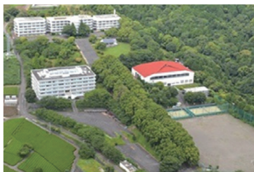
拠点設置予定地の東海大学跡地

アグリイノベーションは科学技術を活用して農業の革新を目指す取り組みです。具体的には、科学技術を活用して栄養素の一部を高めた商品の開発や、環境制御による安定した栽培システム、効率性・省エネ性の実現による増産体制の確立などに取り組みます。