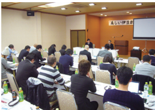
「広域観光人材育成事業」研修風景

同センターが実施する「伊豆半島広域観光人材育成事業」は幅広い視点から観光活性化に取り組む人材の育成を目的としており、当金庫は事務局として昨年12月より事業運営に参画しています。