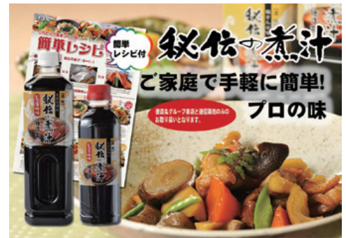
至高の逸品「秘伝の煮汁」

企業が成長するためには人材育成が不可欠であると考えています。東伊豆支店の支店長を通じて、三島信用金庫がお客様向けに様々なセミナーや勉強会を開催していることを知り、経営の中核を担う管理職の「経営感覚」をより磨きたいと考え開催しました。