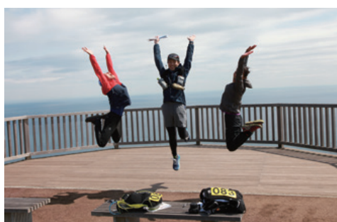
ジオポイントでジャンプ ロゲイニング大会

3月には、ジオポイントを巡るロゲイニング大会を開催(首都圏を中心に約300人が参加)し、交流人口の増加に貢献しています。