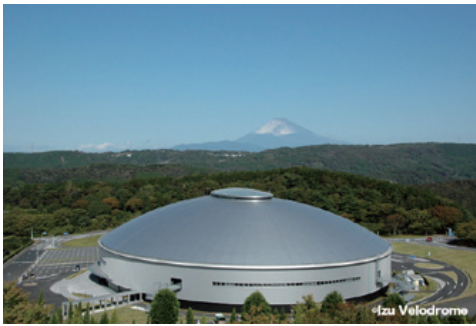
伊豆市 ベロドローム

リオデジャネイロ五輪がまもなく開幕し、世界各国がスポーツの祭典に熱狂する熱い夏がやってきました。