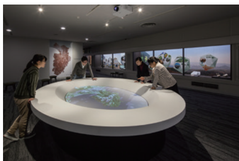
「おしゃれ」と好評なジオリア

伊豆半島ジオパーク推進協議会は、伊豆半島全域の活性化を目指して「周辺海域も含めた貴重な自然遺産の保全」「教育分野への活用」「地域振興」を三本柱に活動しています。