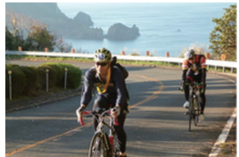
伊豆半島の自然を巡るサイクリング

全国的な代表例では、瀬戸内7県が連携して取り組んでいる「瀬戸内広域観光周遊ルート」事業があります。しまなみ海道を中心とした「サイクリングゾーン」を着地型観光の目玉として“サイクルオアシス”や“サイクリスト専門の宿”など新たなビジネスモデルが誕生しています。