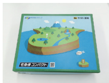
ジオをデザインしたご当地ボックス

ジオサイトを模した創作菓子の製造販売や、ロゴマークを使用した地域限定パッケージ、ジオツアーを取り入れた宿泊プランなど、会員特典を活用した取り組みが始まっています。