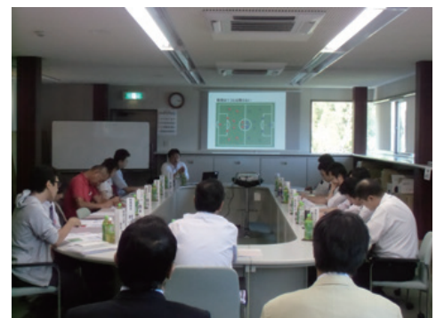
第3回経営幹部勉強会

勉強会や研修は習得した内容を現場で活用することが目的です。今後も業務の習熟度や職務、職位に応じて定期的に行い、社員のスキルアップに取り組んでいきたいと考えています。