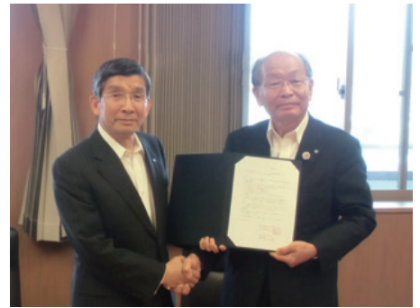
連携協定調印式（函南町役場にて）

美しい伊豆創造センターは「世界一美しい半島プロジェクト」を基幹戦略に掲げ、様々な機会・機能を集中して環境・営み・人の3面で伊豆半島を磨き上げ、世界ブランドとして確立・発信することを目指しています。