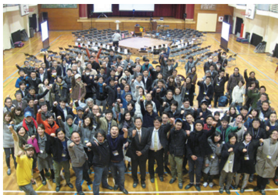
2月に開催されたトレジャーハンティング

リノベーションまちづくりは、エリアを定め「増加する遊休不動産を再生し、新しい使い方、新しい空間を生み出す」という取り組みです。