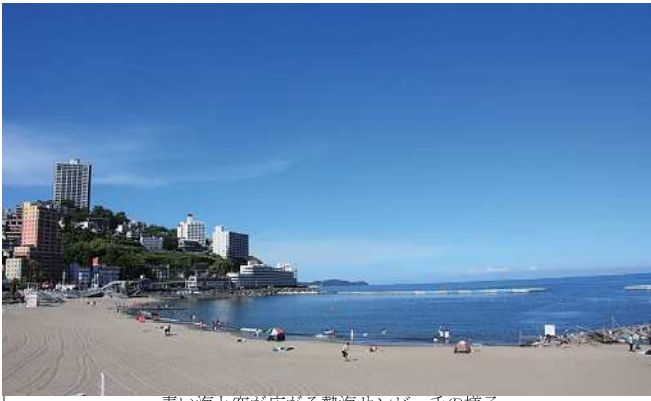
青い海と空が広がる熱海サンビーチの様子