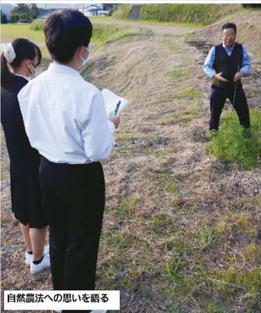
自然農法への思いを語る

取り、何か行動を 起こさなければい う間に合わないど う間に合わないど 思い、飛び出しま した」最初は何を 企画しても、「ど うせだめだ」「無 理だ」と言う人た り、何も始まりませ ん」と力強く語る 浅田さん。上手く いかないこともあつ たが、次の成功の データ取りだと自 分に言い聞かせ、 様々なことに