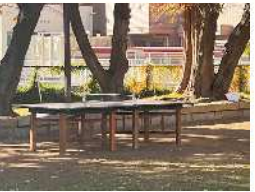
▲卓球台が設置された

REFSがこれまでに実施してきたイベントの中に「一杯のスープをつくる時間」がある。このイベントは、スープを飲む器を作るために木を切る過程から始まり、器が出来上がるまでの約半年間、スープレシピとなる野菜の生産者の方の手伝いをするというものだ。