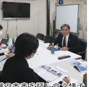
地域の未来を話し合う様子

私たちが地域である三島が良いと知って、多くの人に求めているように貢献すること」と教えてくれた。そのため、三島市にあるウイスキー工場の設計を手がけるなど、長年培ったノウハウを、展示された工場設計などに