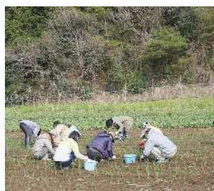
▲畑仕事を体験する