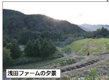
浅田ファームの夕景

苦くましく します。 自然農法では、自然を先生にします。仮説を立てて試みます。すると、何年か経って自然が答えを返してくれる。やり始めた頃は大変でしたが、何度も試して良い土ができました。手間暇かけて育てた米や野菜がよくできたときは、涙を流すほど嬉しかった。今では、他県の農家の方々が視察に来るようになりました。