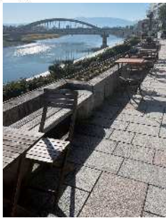
▲狩野川河川敷に机と椅子が設置された