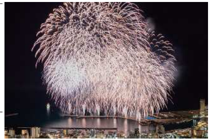
熱海海上花火大会の様子

商品も選ぶ理由の中に「ブランドイメージ」というのはあるだろう。観光地も例外ではなく、箱根などの観光地は