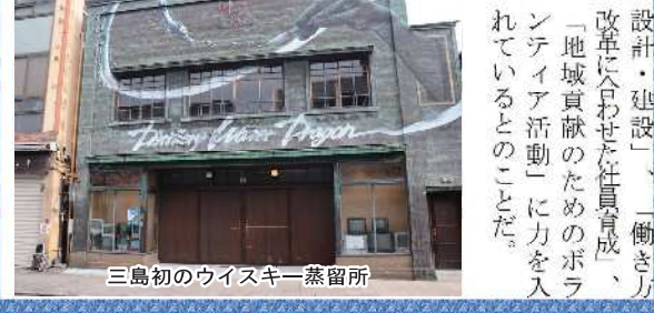
三島初のウイスキー蒸留所

ホモジナイザーでは日本では最古参の企業であり、国内3本の指に入るほどの実績ある企業である。その秘訣としては「モノづくりは、夢の共有とあきらめない気持ちが大変重要。さらにクライアントに寄り添い、ニーズに合わせた製品の提供と、故障などへの迅速な対応」と教えてくれた。