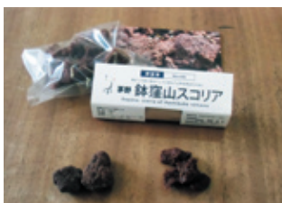
本物そっくりの「伊豆市茅野 鉢窪山スコリア焼きチョコ」

私達は「この伊豆地域の大地の面白さを分かりやすく伝えたい」との思いのもと、もっとこの地の魅力をアピールし、そのためのツールを開発し、伊豆全体の活性化を図りたいと考えていました。そのひとつの帰結が、ジオ（風景）を切りとってお菓子にするという発想でした。