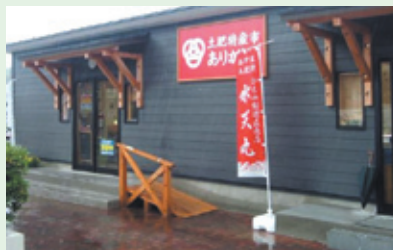
土肥特産市ありがとう 外観

土肥の土肥温泉旅館協同組合が新しい形の1つとして経営管理をしている地域密着型ショップ『土肥特産市ありがとう』さまは、土肥で収穫または加工されたものに特化し販売されています。複数の関係者の方々