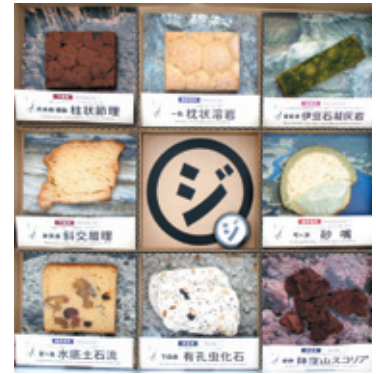
8 ジオ入りコンプリートBOX

今後も人が訪れて楽しめ、ジオパークの面白さが伝わる仕組みづくりを行っていきます。