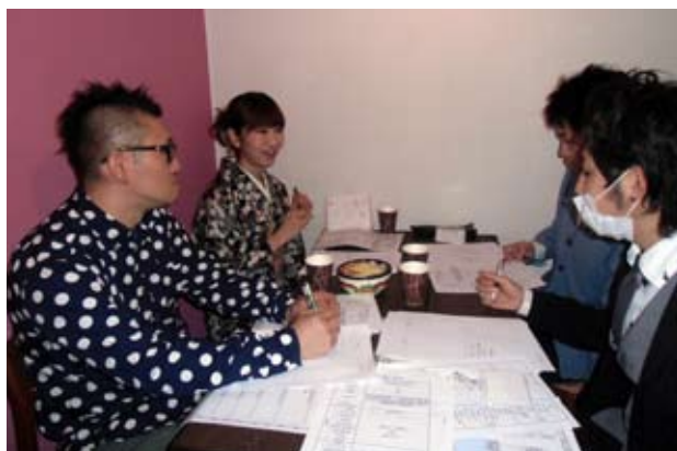
異業種交流が活発に行われています

今回参加した19名を4-5名の小さなグループに分け、会員が経営する企業の分析を実施しました。