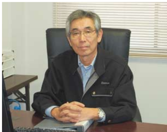
お客様が期待する以上の感激と感動をお届けします

※「利子補給制度」とは、『ふじのくに先端医療総合特区』に関連する医療機器・医薬品の生産設備新增設や研究開発について三島信用金庫等指定金融機関から融資を受けた場合、5年間の融資金利について最大0.7%の補助が受けられます。医療分野への参入をご検討されている方はぜひご活用下さい。