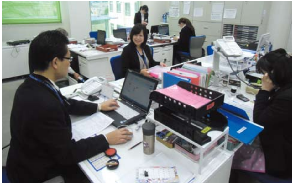
4月からの販売に向けて奮闘中の個人サポート課職員

通院・在宅による治療（手術に拠らない治療）は患者の方の体力的な負担を軽くするメリットがありますが、経済的な負担はケース・バイ・ケースです。既に多くのお客様は、何らかの医療保険や共済等にご加入されている場合が多いと思いますが、従来型の入院給付金に重きを置いた保険の場合、例えば、入院すること