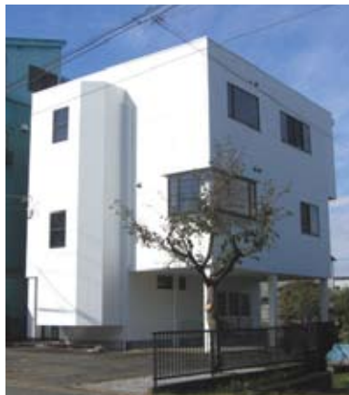
現在、医療系ソフトウェア開発のノウハウを蓄積しています

グを行い新たな取り組みをするまでに至りました。「今後、電子カルテのソフトウェア開発なども行い、医療分野への参入を着実に進めていく」と北條社長は語ります。