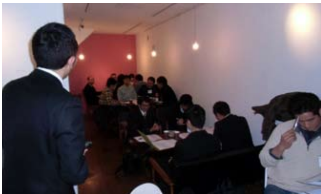
会議室では出ないアイデアが次々に生まれました

SWOT分析とは企業の持つ内部資源や置かれている外部環境を分析し戦略を策定するフレームワークです。