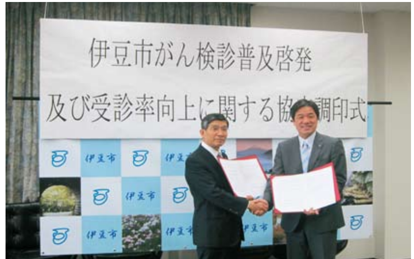
がん検診の受診率向上に努めます

平成 25 年 2 月 12 日、三島信用金庫は伊豆市と「伊豆市地域経済に関するパートナーシップ協定」及び地域貢献の一環として伊豆市が実施する「がん検診の受診率向上に寄与する活動」に協力をするため「がん検診普及啓発活動及び受診率向上に関する協定」を締結しました。主な活動については、伊豆市内営業店にてポスターやチラシ等