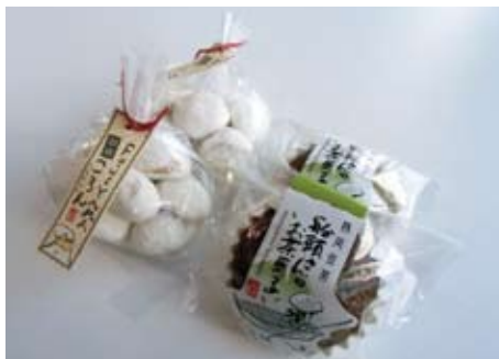
一押しスイーツ『FUJIYAMA 胡桃コロロン』と『船頭さんのお茶菓子』

をもち、和が基本にありながらも他のテイストを加えることで独創的なスイーツを作り出しています。