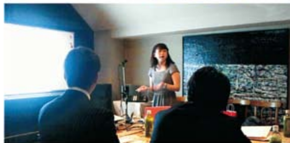
異文化交流を毎月おこなっています