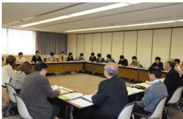
伊豆地域活性化について静大生も真剣に考えています

同ゼミ生からは、三島信用金庫の業務内容や地域活性化への取組みについて、かなり突っ込んだ質問が出されたほか、地域活性化に向けた当金庫の役割等について学生ならではの視点で提言がなされるなど、活発な意見交換がおこなわれました。