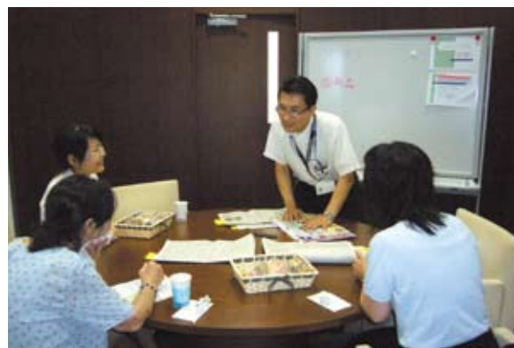
資産運用のことならなんでもご相談下さい

不安定・不確実な時代を生き抜くためには、大切な「お金」を目的に合った資産にバランスよく配分するのが何よりも大切です。一人で考えるのではなく、ご家族で「さんしん」のサポートセンターの相談機能をご利用ください。