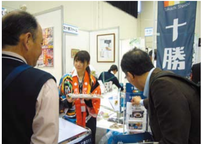
職員もスタッフとして頑張りました

のお取引先さま以外に業務提携先である北海道の帯広信用金庫さまや特別協力として県西部からは遠州信用金庫さまのお取引先さまについても多数ご参加いただきました。当日の来場者は1,000名、バイヤーさまにも多数ご来場いただき、商談数も300件超と大盛況となりました。