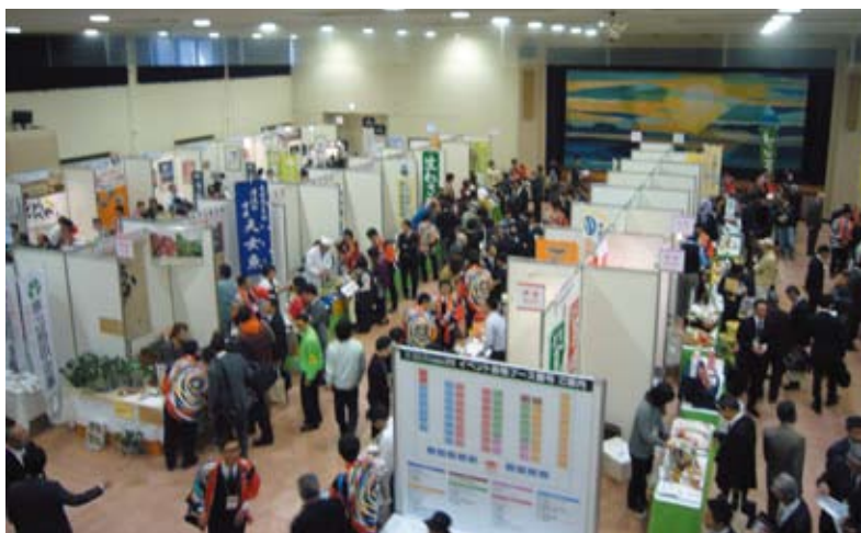
「食と農」ビジネスマッチングは今年も大盛況

ビジネスマッチングとは、販売先、仕入先、連携先などの事業パートナーと出会うきっかけを作るいわば企業同士の「お見合いの場」です。平成24年11月21日、三島信用金庫がイニシアティブをとり、県東部4信金共同主催にて『静岡県東部・十勝帯広ビジネスマッチング「食&農」こだわりの逸品展示会2012』が開催されました。参加企業は営業エリア