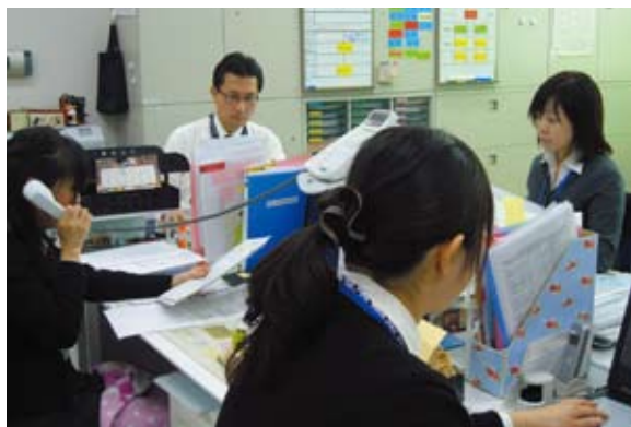
年金に関する問い合わせに真摯に対応しています

「さんしん」の口座で公的年金をお受け取りいただくと、年金友の会「ゆとり倶楽部」の会員になり、各種の優遇を受けることができます。現在、会員数約56,000名にもなります。平成24年度現在の主なサービス