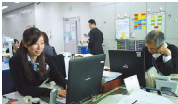
ローンのことならなんでもご相談下さい！

ローンセンターでは、月曜日～土曜日（祝日を除く）9:00～17:00 営業しているほか、平日や土曜日に来店できないお客さまのために、定期的に日曜日住宅ローン相談会を開催しております。これまでには、5月13日（日）、8月12日（日）、11月11日（日）に開催し、多くのお客さまにご来店いただきました。ブロック内の協力店舗により、11月11日（日）のローン相談会では、