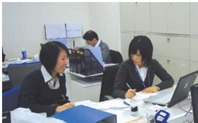
企業の課題解決に取り組んでいます

後継者問題は中小企業の永遠の課題です。事業承継と一口に言っても、代表者を親族に承継させる場合と親族外に承継させる場合、また、親族外承継においても、従業員に継がせるのか、第三者へ売却するのか(M&A)により承継方法は異なってきます。当部署には事業承継支援ノウハウを持った中小企業診断士を配置し、公認会計士や税理士などの外部専門家や支援機関等との連携により事業承継の支援を行っています。