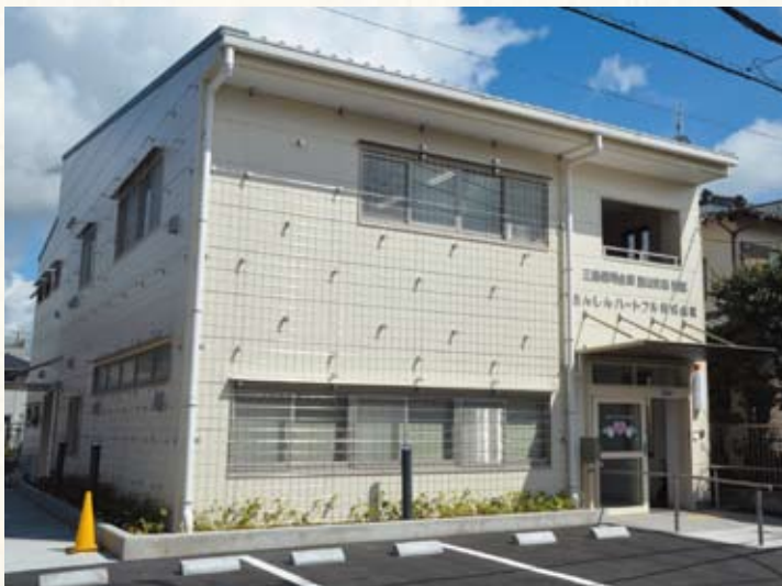
さんしんハートフル株式会社

センターに職員を派遣するなど協力しています。平成 24 年 3 月には地域経済の発展に寄与することを目的として、国立大学法人静岡大学と産学連携協定を締結いたしました。また、行政の力と民間金融機関の力の連携により、コミュニケーションを深めスムーズで密な情報交換や支援を通し地域の面的な再生を図るために熱海市、伊豆市、三島市とそれぞれ「地域活性化に関するパートナーシップ協定」を、三島市とはさらに「がん検診普及啓発及び受診率向上に関する協定」を締結するなど、お客さまのニーズにお応えできるよう、地域とのネットワークを強化しています。