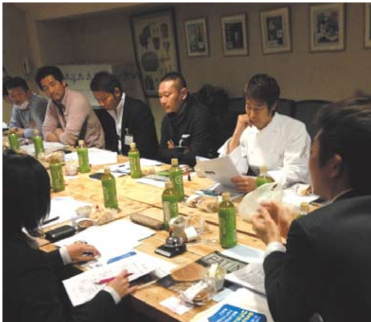
チャレンジクラブで自分磨きを!

さんしんチャレンジクラブとは、今後の地域経済を担う後継者を育成する目的で設立された若手経営者クラブです。平成22年に創設され2年周期で卒業する制度となっており、現在は第2期生が『つながり』、『成長』、『楽しさ』というコンセプトの下に毎月1回勉強会を行い切磋琢磨しております。他のセミナーや勉強会と異なる点として、クラブ内で三島信用金庫はあくまで事務方に徹し会員に主導権を与えることで、会員同士が